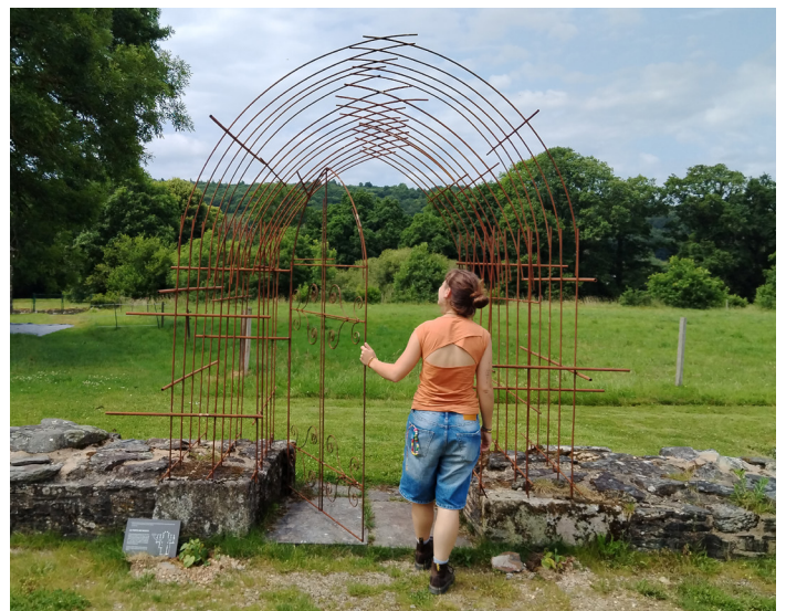
Porte des morts réalisée lors de la résidence 2025