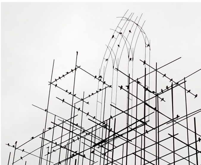
Vue sur Élévation réalisée lors de la résidence 2025